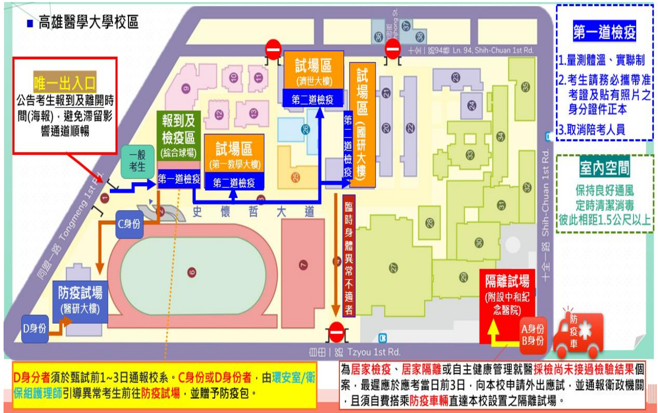
圖一：校園動線平面圖